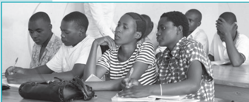
Ces jeunes domestiques suivent l'atelier d'alphabétisation fonctionnelle initié par ADPM à Kigali ( Rwanda - mai 2005 ).

Tous nos jeunes parrainés individuellement bénéficient d'un accompagnement par le partenaire local (associations de défense des Droits de l'Homme, associations de femmes, ...) tant du point de vue social que scolaire.