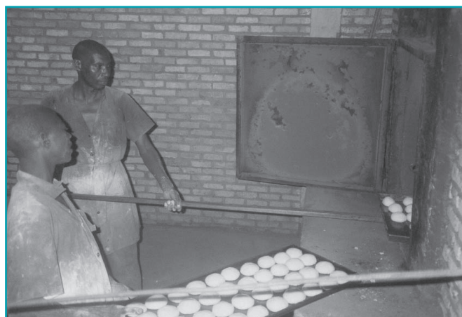
Formation professionnelle en boulangerie pour jeunes déplacés des collines – Burundi – janvier 2007

Tous ces projets se réalisent en partenariat avec des associations locales (associations de défense des Droits de l'Homme, associations de femmes, ...).