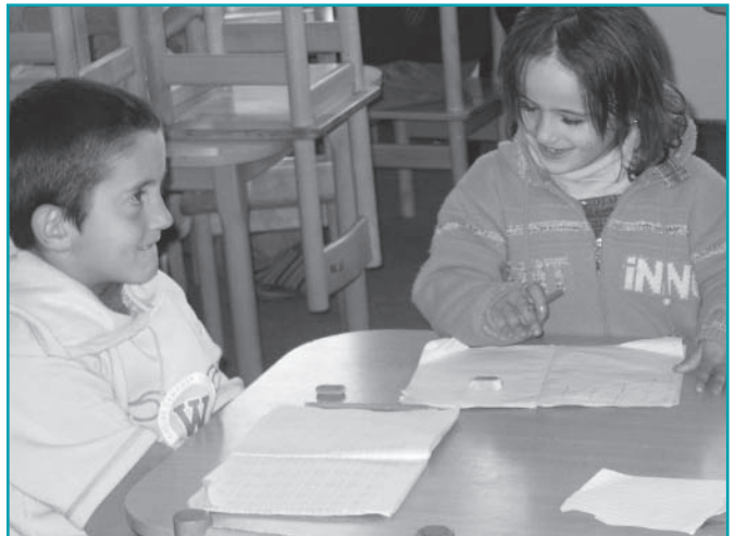
Deux jeunes enfants déplacés parrainés en éducation primaire – Bosnie - Nov.2006